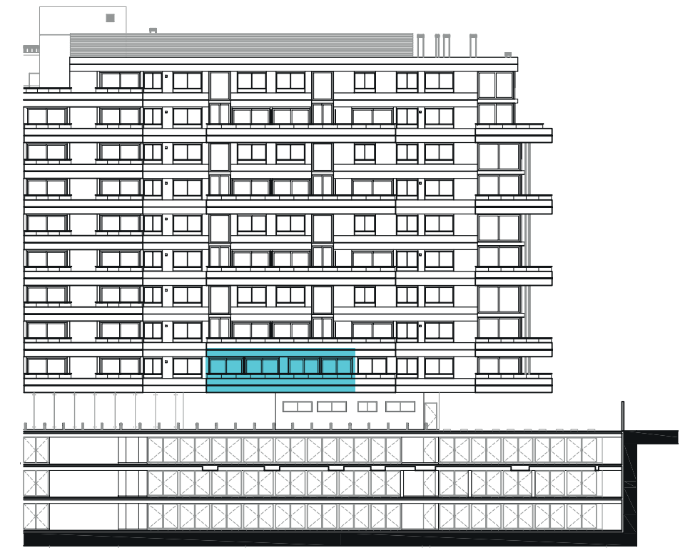
UBICACIÓN EN ALZADO