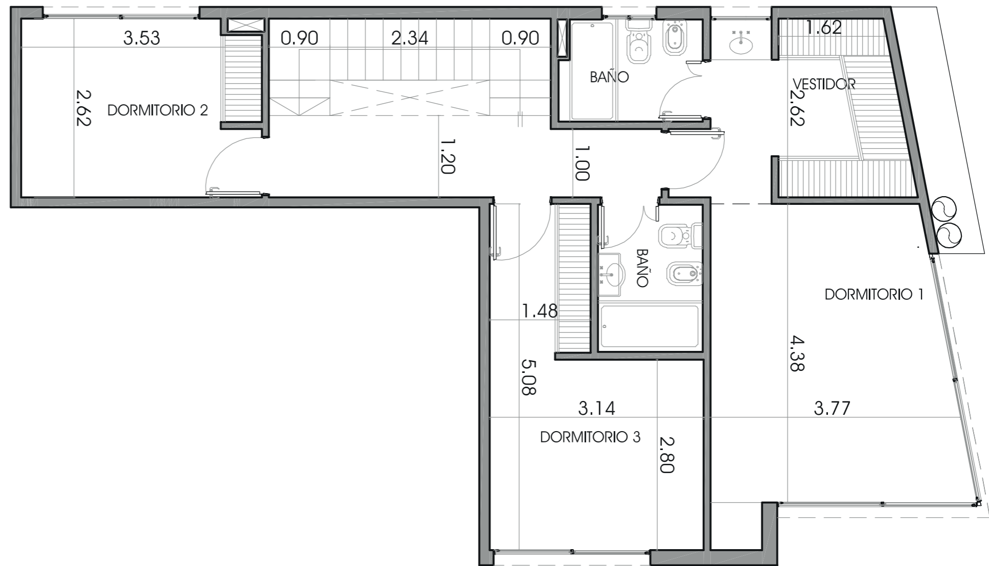
PLANTA ALTA DE LA UNIDAD