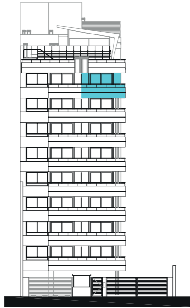
Calle Río De Janeiro