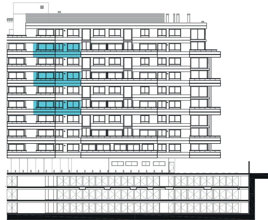
UBICACIÓN EN ALZADO